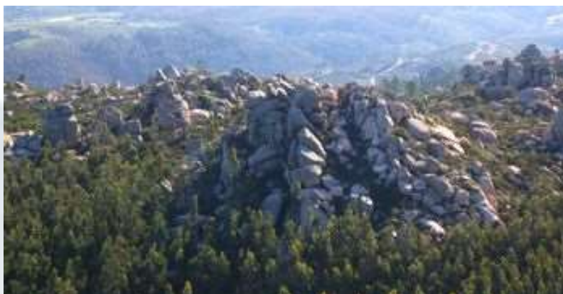
Pedra Amarela - ICNF

O concelho Sintra encontra-se recheado por um património natural, histórico, arquitectónico e sobretudo cultural, destacando-se como um lugar especial no que a estes aspectos confere, sendo caso sem paralelo em Portugal, na Europa e no Mundo, pela sua complexidade e, também, pelo característico sincretismo aqui verificado entre Património Natural e Património Construído.