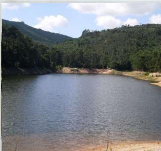
Barragem do rio da Mula - natural.pt

A histórica vila de Sintra encontra-se ladeada pela serra de Sintra. Vista de longe (ou a partir de uma fotografia aérea) ela dá a impressão de uma paisagem muito mais natural que se distingue bem dos arredores: uma pequena cadeia montanhosa granítica coberta de florestas, elevando-se da região rural (também ela entrecortada por montes e vales) entre Lisboa e o litoral. Vista de mais perto e percorrendo-a, a Serra revela marcas culturais de uma riqueza surpreendente, cobrindo vários séculos da história de Portugal.