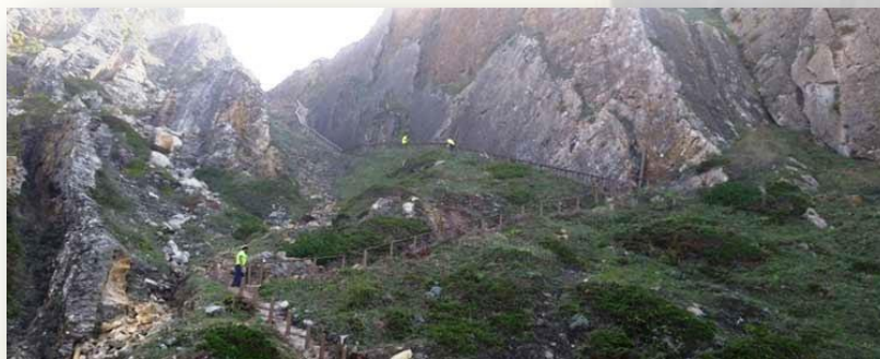
Pegadas dos Dinossauros - CM Sintra

O Cabo da Roca “Onde a terra se acaba e o mar começa” (in Os Lusíadas, Canto III) é o ponto mais ocidental de Portugal continental, assim como da Europa continental.