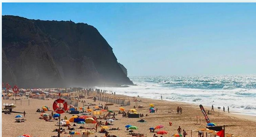
Praia Grande do Rodízio – CM Sintra

O Cabo da Roca é o ponto de início deste percurso.