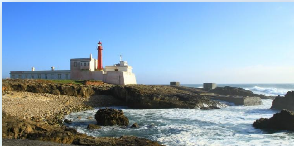
Cabo da Roca - CM Sintra

O concelho Sintra encontra-se recheado por um património natural, histórico, arquitectónico e sobretudo cultural, destacando-se como um lugar especial no que as estes aspectos confere, sendo caso sem paralelo em Portugal, na Europa e no Mundo, pela sua complexidade e, também, pelo característico sincretismo aqui verificado entre Património Natural e Património Construído.