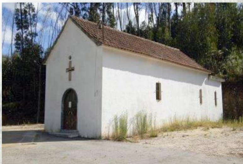
Capela de São João Batista - JF Ferreira do Zêzere

Durante todo o percurso temos uma paisagem deslumbrante podendo avistar as localidades da aldeia da Pombeira, Zaboeira, Alcamim, a maravilhosa albufeira de Castelo de Bode e as suas claras águas. Observamos também a riqueza histórica da Capela São João Batista e Santo António.