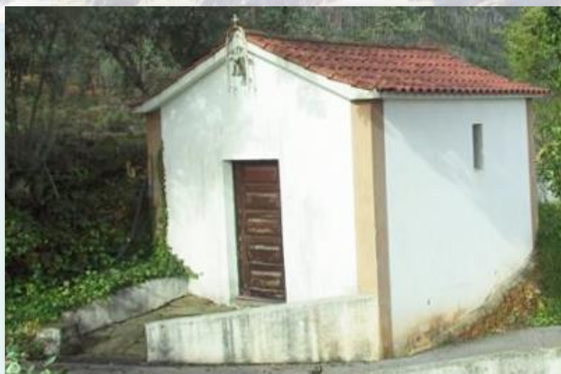
Capela de Santo António - JF Ferreira do Zêzere

Durante todo o percurso poderá ser observada a riqueza e diversidade na fauna e flora podendo ser observadas as seguintes espécies: Acacia, carqueja, eucalipto, giesta, medronho, oliveira, pinheiro, ranunculo aquatico, sobreiro, tojo, urze. A guia de asa redonda, borboleta, bufo real, ca gado, coelho bravo, coruja, corvo, cuco, doninha, esquilo, falca o, gaio, gaivota, galinha agua, garça-real cinzenta, guardarios, javali, lagartixa, lagarto comum, libe lula,