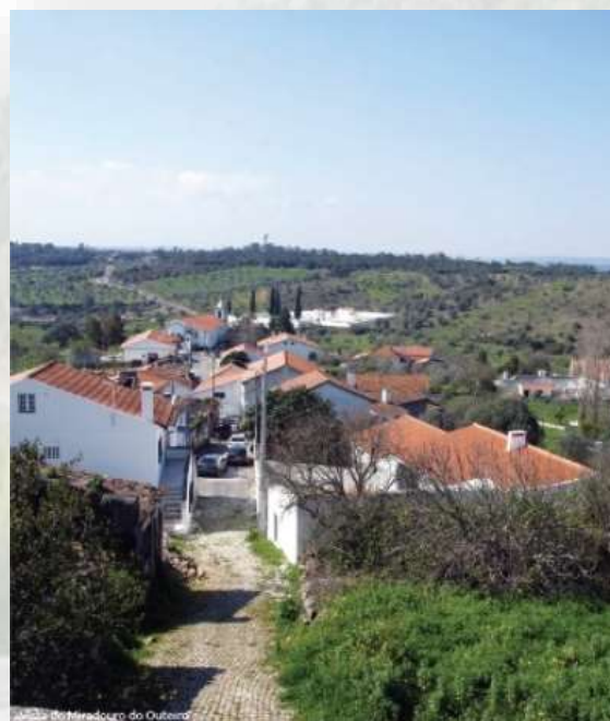
Miradouro do Outeiro - CM Alcanena