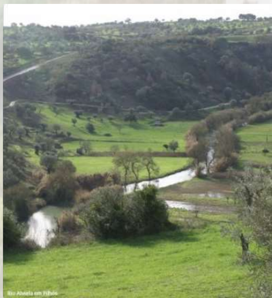
Rio Alviela em Filhós - CM Alcanena

altura que segue para Casais Romeiros, onde visita a Fonte Natural do Poço da Costa.