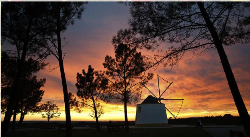
Moinhos de Entrevinhas

Seguidamente irá percorrer a antiga estrada que liga a Lapa ao Porto de Mação, a qual, embora alcatroada, se encontra bem enquadrada na paisagem. No Porto de Mação encontrará ruínas de várias azenhas e o percurso prossegue numa antiga levada de água, nas margens da Ribeira das Sarnadas. Recomenda-se prudência, dado este troço apresentar algum perigo. Nesta parte do percurso, poderá encontrar vestígios da presença de javalis e de lontras. No final da levada está sinalizado um desvio para visitaç o de uma ponte medieval/moderna oculta na galeria rip cola.