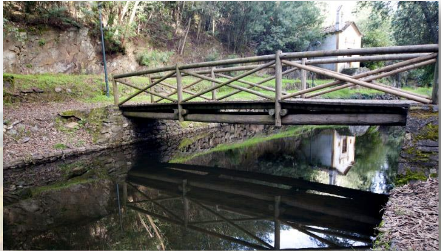
Capela da Senhora da Lapa – CM Sardoal

Assim, e tomando como ponto de partida a Lapa, desde logo poderá apreciar o espelho de água e a Capela da Senhora da Lapa: esta pequena Capela rural foi edificada na década de 50 do século XVII por ordem do abade João Cansado.