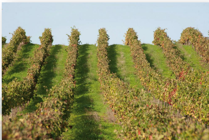
Quinta do Vale do Armo - CM Sardoal

O regresso ao ponto de partida (Lapa) faz-se primeiro pelo meio das vinhas e depois por terrenos mais ou menos acidentados, que acompanham linhas de água intermitentes.