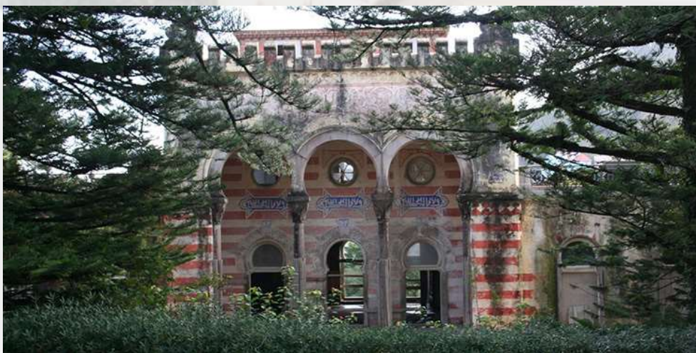
Quinta do Relógio - CM Sintra

A histórica vila de Sintra encontra-se ladeada pela serra de Sintra. Vista de longe (ou a partir de uma fotografia aérea) ela dá a impressão de uma paisagem muito mais natural que se distingue bem dos arredores: uma pequena cadeia montanhosa granítica coberta de florestas, elevando-se da região rural (também ela entrecortada por montes e vales) entre Lisboa e o litoral. Vista de mais perto e percorrendo-a, a Serra revela marcas culturais de uma riqueza surpreendente, cobrindo vários séculos da história de Portugal.