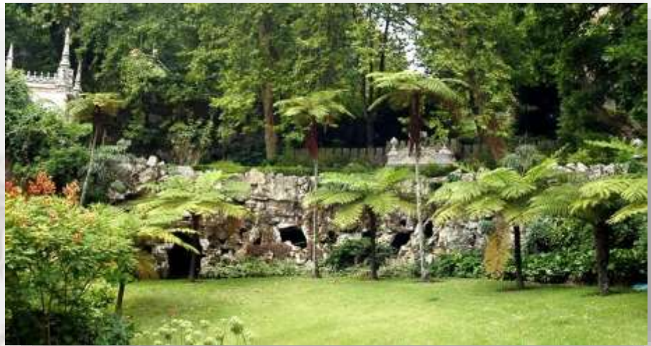
Quinta da regaleira - CM Sintra

É um traçado com um desnível moderado e que pretende dar a conhecer, no limite da Vila Velha de Sintra, as principais e ancestrais Quintas, destacando-se a Quinta do Castanheiro, que detém ainda um belo exemplar destas árvores junto ao muro. O caminho retorna para a Vila de Sintra pelo caminho dos Castanhais.