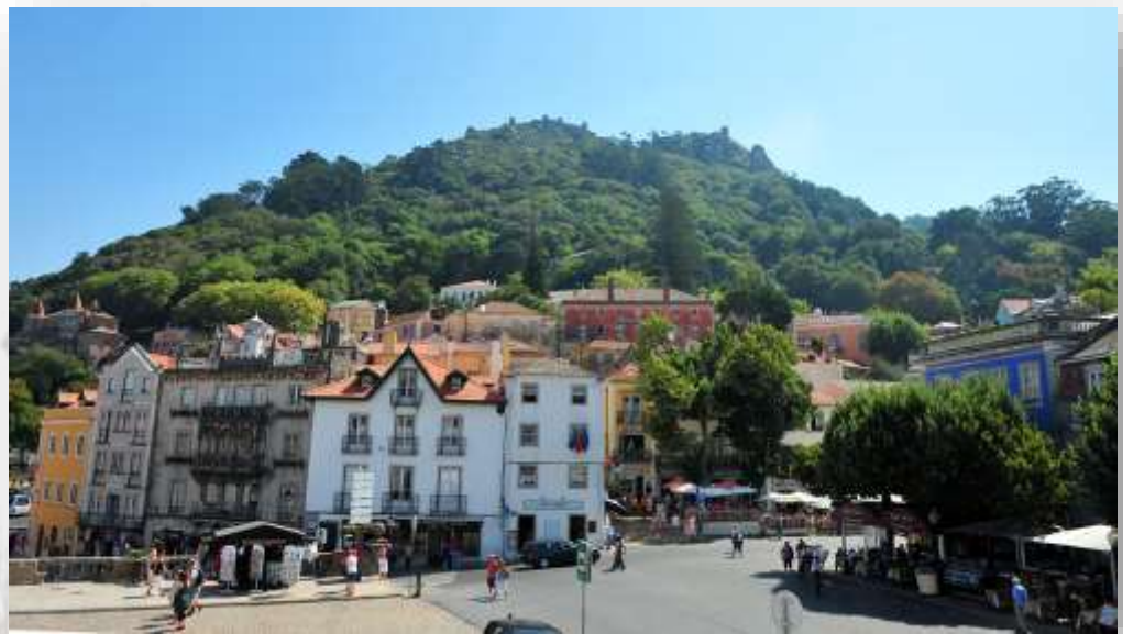
Centro histórico de Sintra

O concelho Sintra encontra-se recheado por um património natural, histórico, arquitectónico e sobretudo cultural, destacando-se como um lugar especial no que as estes aspectos confere, sendo caso sem paralelo em Portugal, na Europa e no Mundo, pela sua complexidade e, também, pelo característico sincretismo aqui verificado entre Património Natural e Património Construído.