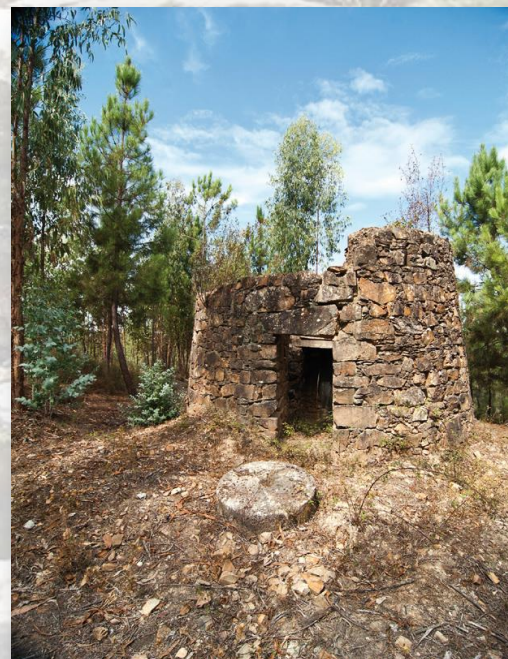
Ruínas do Moinho de Chã Grande

Mais adiante, no Pisão Fundeiro poderá apreciar uma ponte medieval/moderna e as ruínas de um lagar. Chegando ao Vale Formoso, passará por ruínas de antigas habitações e, mais adiante, ao lado de um lagar que laborou até finais da década de noventa do século passado. Depois de passar pelo Pisão Cimeiro, chega à bonita aldeia da Saramaga, local de várias fontes, onde poderá refrescar-se. Será perto de Casos Novos, o local mais propício do percurso para encontrar vestígios da fauna que por aqui domina: a raposa, o javali, o sacarrabos e o coelho. Ao chegar a Chã Grande, encontrará as ruínas de um dos muitos moinhos de vento que existiram nesta freguesia e que noutros tempos marcavam a sua paisagem.