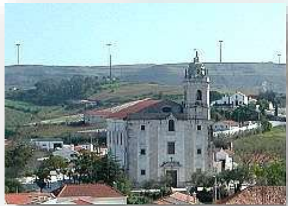
Turcifal - JF Turcifal

O percurso “Rota dos Encantos” tem o seu início junto à Igreja Matriz do Turcifal, seguindo depois em direção à Junta de Freguesia, virando à esquerda para passar pela encantadora Capela do Espírito Santo. Após passar pelo complexo desportivo segue por entre vinhas, em direção ao Campo Real, passando pelos campos de Golfe até chegar à Cadriceira. A partir daqui tem início a subida à Serra do Socorro, por entre densos eucaliptais, que será recompensada por uma vista deslumbrante do seu topo, onde se situa a Ermida da Senhora do Socorro. Inicia-se então a descida, passando junto à Quinta de À-do Guerra, seguida de nova subida à Serra do Monte Deixo.