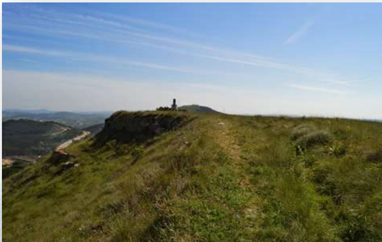
Forte da Feteira - ICNF