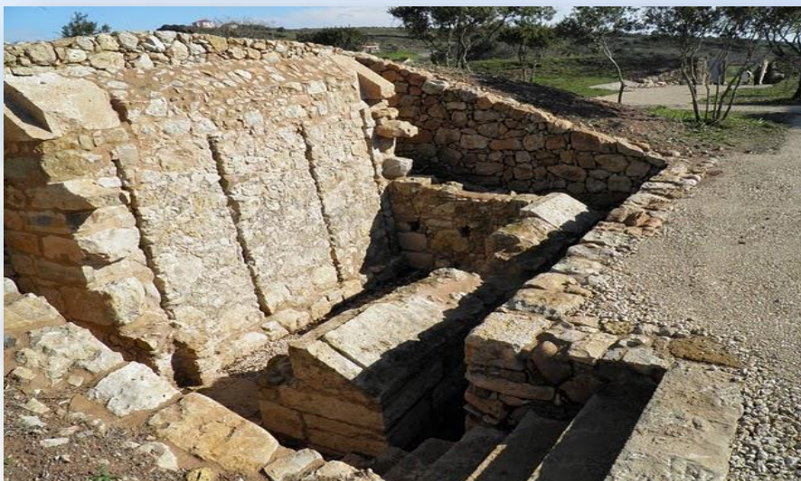
Forte do Arpim

Apresenta dificuldade média na primeira parte do percurso até à zona do Serves. Segue parte do traçado do GR30. Permite a circulação pedonal e ciclável.