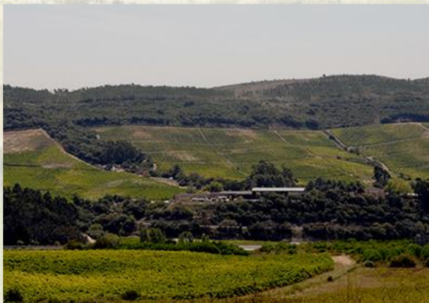
Quinta da Romeira - CM Loures

Tem como motivo principal a temática das Linhas de Torres, com o Centro de Interpretação das Linhas de Torres no Museu, o Forte do Arpim e o GR30. Tem também muito interesse paisagisticamente, quer sobre o Vale de Bucelas quer para o Tejo, em particular do Forte da Aguieira (Vila Franca de Xira). Passa junto à Quinta da Romeira.