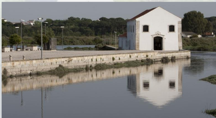
Moinho de Maré de Corroios

O traçado deste trilho faz parte de uma rede de 42km de percursos pedestres que pretende divulgar os recursos naturais, biodiversidade e património construído do município do Seixal, nas duas áreas vitais no contexto do nosso território: Baía do Seixal e Zona Húmida Adjacente e parte do Sítio de Importância Comunitária Fernão Ferro – Lagoa de Albufeira (SICPTCON0054), integrado na Rede Natura 2000 (ao abrigo da Diretiva Habitats).