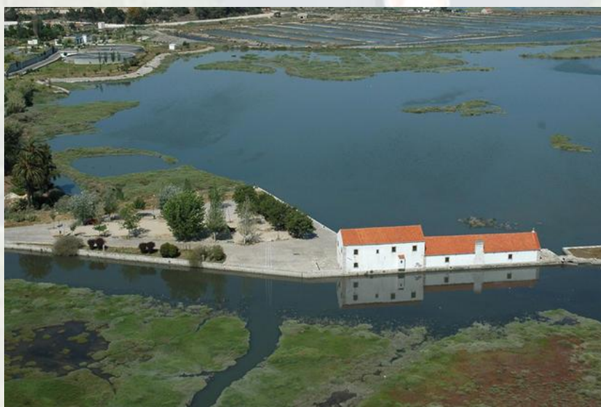
Moinho de Maré de Corroios

Esta rede de trilhos, ainda em fase de implementação, obteve financiamento do Programa Operacional de Sustentabilidade e Eficiência no Uso dos Recursos (candidatura POSEUR-03-2215-FC-000017, aprovada a 20 de abril de 2016), no âmbito de ações de sensibilização para a conservação da natureza e biodiversidade, traduzida na conceção e implementação de uma plataforma tecnológica, cujo aplicativo móvel - Seixal APPé