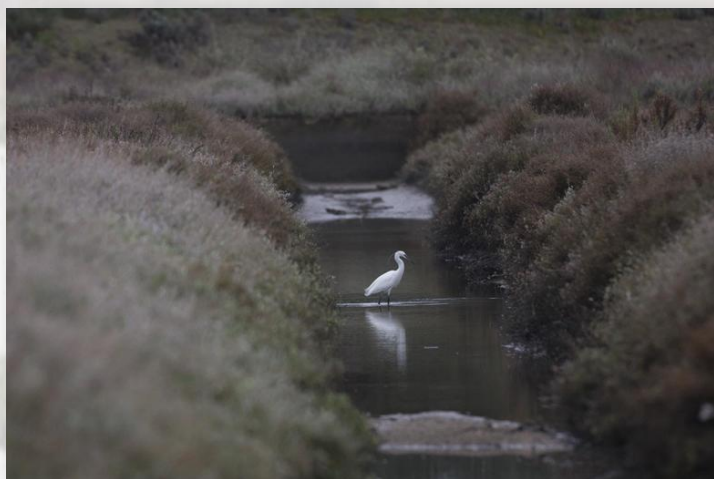
Avifauna da Baía do Seixal – CM Seixal

Esta rede de trilhos, ainda em fase de implementação, obteve financiamento do Programa Operacional de Sustentabilidade e Eficiência no Uso dos Recursos (candidatura POSEUR-03-2215-FC-000017, aprovada a 20 de abril de 2016), no âmbito de ações de sensibilização para a conservação da natureza e biodiversidade, traduzida na conceção e implementação de uma plataforma tecnológica, cujo aplicativo móvel - Seixal APPé estará brevemente disponível para android e iOS e acessível ao público em geral.