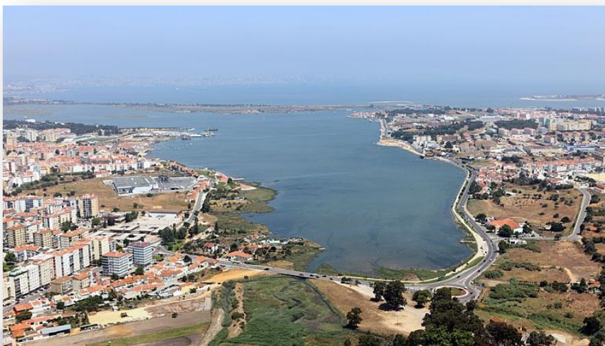
Baía do Seixal - CM Seixal

O traçado deste trilho faz parte de uma rede de 42km de percursos pedestres que pretende divulgar os recursos naturais, biodiversidade e património construído do município do Seixal, nas duas áreas vitais no contexto do nosso território: Baía do Seixal e Zona Húmida Adjacente e parte do Sítio de Importância Comunitária Fernão Ferro – Lagoa de Albufeira (SICPTCON0054), integrado na Rede Natura 2000 (ao abrigo da Diretiva Habitats).