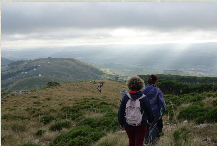
Serra de Montejunto - CM Alenquer

Não deixe de visitar o Miradouro da Cruz Salvé Rainha, onde os monóculos e leitores de paisagem lhe permitirão conhecer melhor esta Serra. A Serra de Montejunto é o miradouro natural mais alto da Estremadura, elevando-se a 666 metros de altura acima do nível médio do mar. Esta estrutura geológica, com 15kms de comprimento e 7kms de largura, é rica em algares, grutas, lagoas residuais, necrópoles e fósseis pré-históricos.