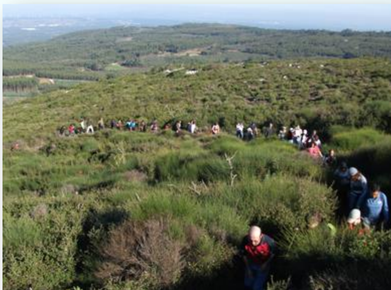
Serra de Montejunto - CM Cadaval

Apenas 65 km a separam da capital, distância que facilmente se percorre utilizando a A8. Pode optar-se, também, pela A1 saindo em Aveiras de Cima sempre na direção do Cadaval. Ao chegar à Serra de Montejunto encontrará um local tranquilo, ideal para escapar à cidade e com muito para descobrir.