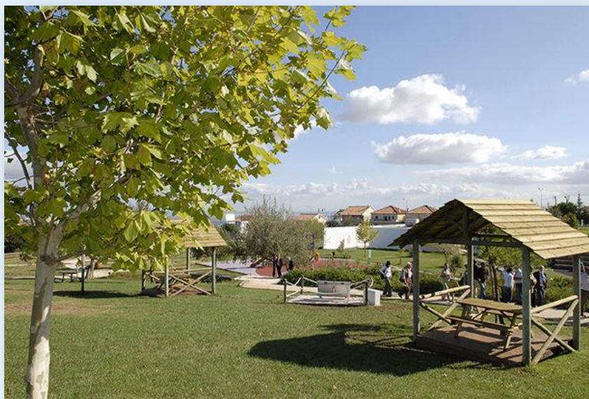
Parque Urbano de Santa Iria da Azóia - CM Loures

O percurso continua na direção da frente ribeirinha do Tejo. A partir deste ponto, inicia-se a subida em direção à Portela da Azóia, terminando no ponto de partida.