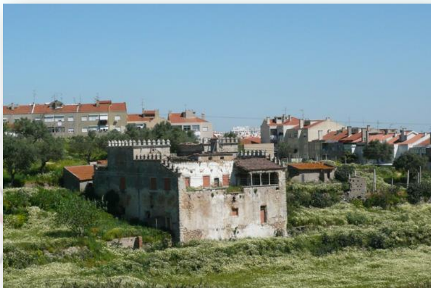
Quinta de Valflores - CM Loures

Construída no século XVI, a Quinta de Valflores é uma referência patrimonial no território do Município de Loures.